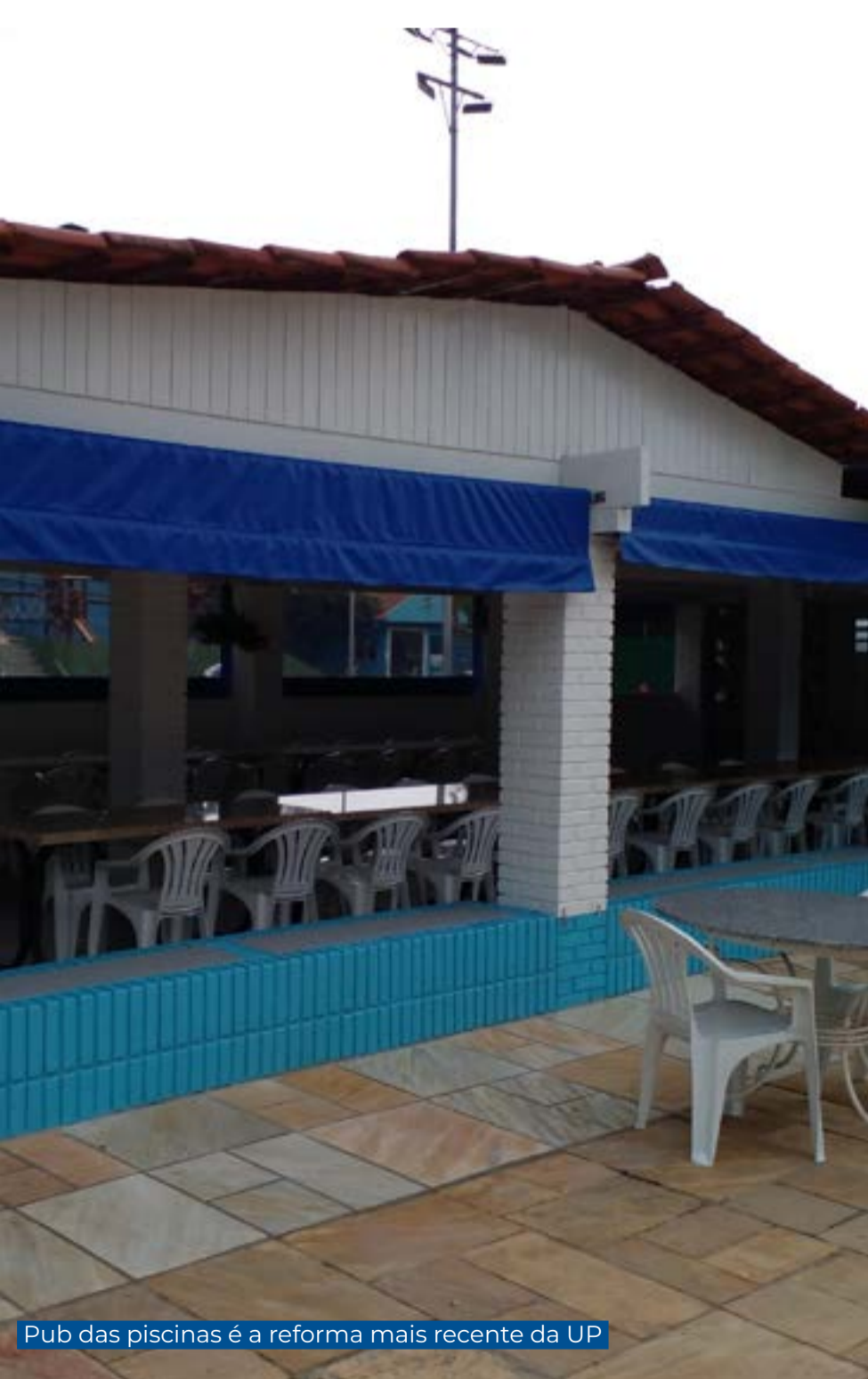
Pub das piscinas é a reforma mais recente da UP