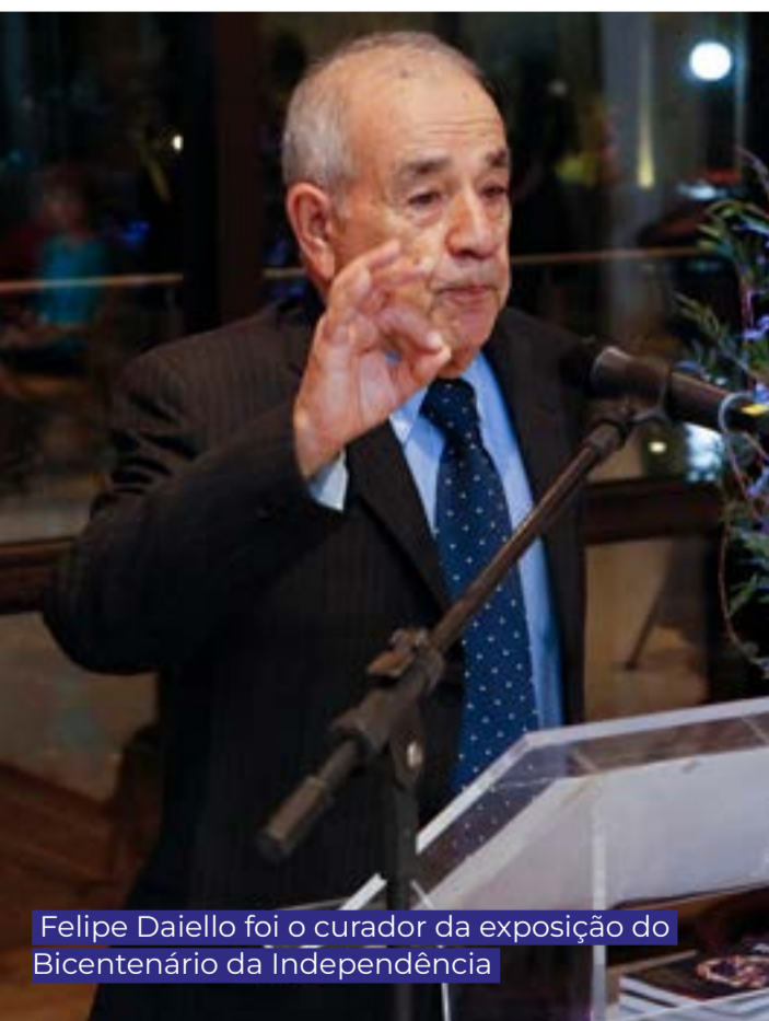
Felipe Daiello foi o curador da exposição do Bicentenário da Independência