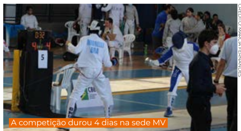
A competição durou 4 dias na sede MV