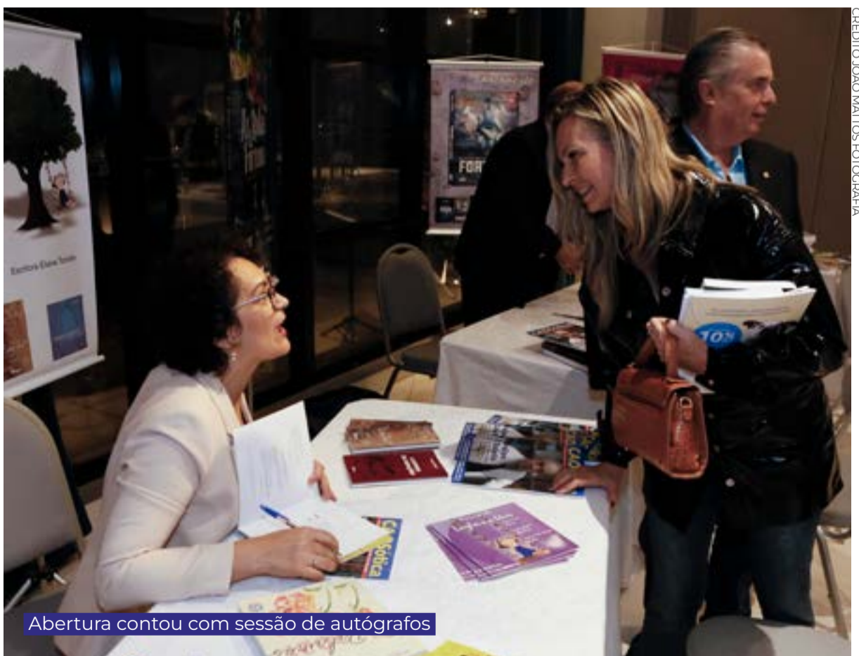
Abertura contou com sessão de autógrafos