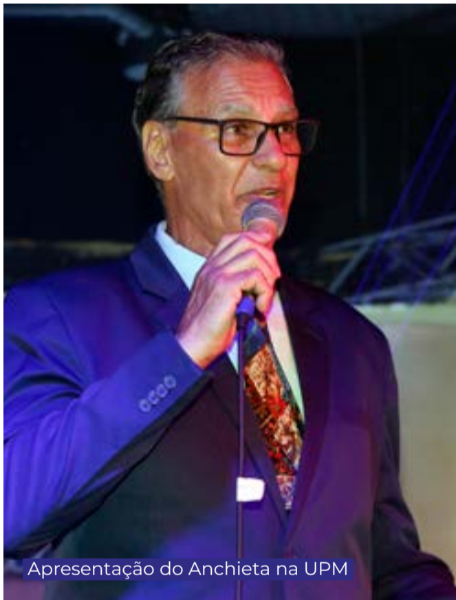
Apresentação do Ancheta na UPM