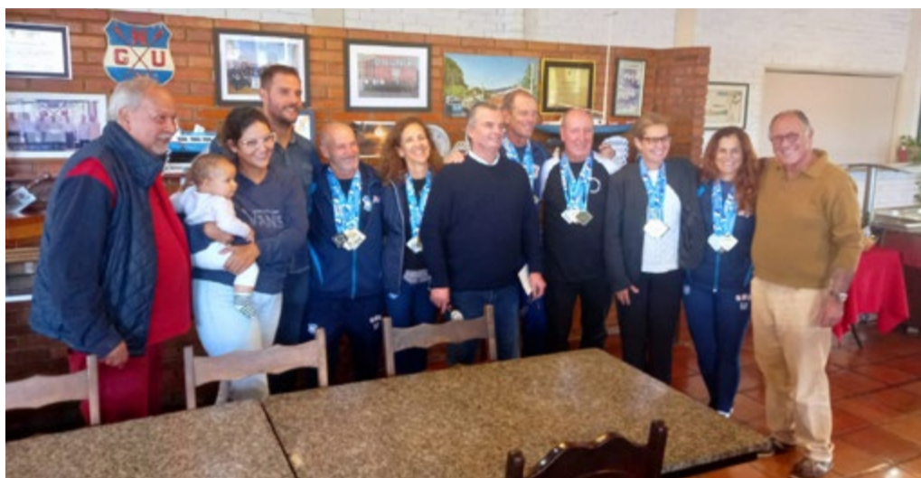
Medalhistas do Remo master no Sul-americano da categoria

A raia olímpica da USP, em São Paulo, foi o palco para os veteranos do Remo unionista brilharem mais uma vez. Com uma participação histórica, os atletas do GNU conquistaram 17 ouros, 17 pratas e 20 bronzes.